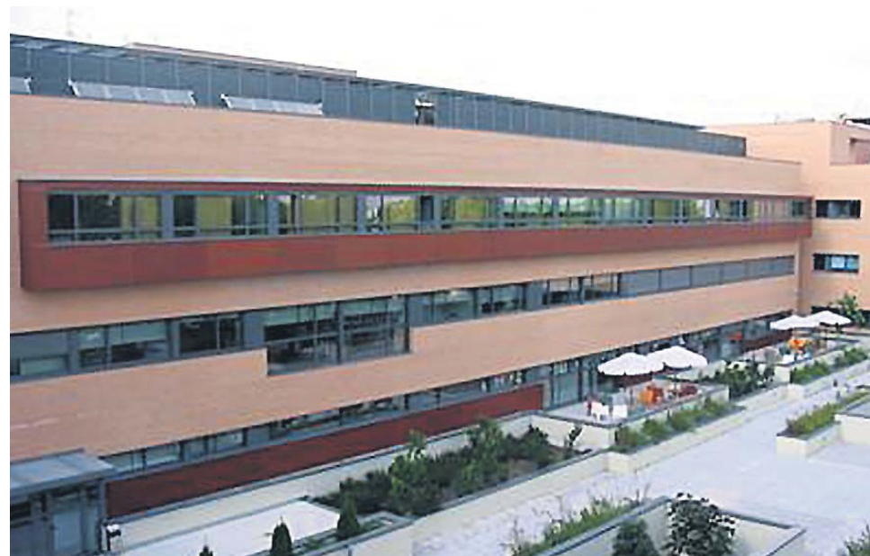
La Unidad Hospitalaria Pediátrica de Enfermedades Avanzadas y Respiro Familiar de la Fundación Vianorte-Laguna se ubica en Madrid y tiene capacidad de 1.760 estancias anuales de niños y adolescentes menores de 21 años.

En definitiva, esta Unidad está mejorando la calidad de vida de los niños y adolescentes, proporcionando además respiro a las familias. También se ha formado a sus familias en buenas prácticas para la atención y cuidados de enfermedades avanzadas. Pero, por encima de todo, “el resultado más valioso, sin duda, es la satisfacción demostrada por las familias de los niños y adolescentes, que nos transmiten su agradecimiento por cuidar de quien más quieren con profesionalidad y cariño”, indican desde la Fundación Vianorte-Laguna. Un reconocimiento que también ha querido transmitir el jurado de los Premios Fundamed&Wecare-u.