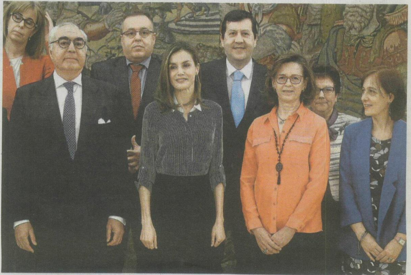
La Reina recibe en audiencia a una representación de la Fundación Vianorte-Laguna